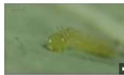
モンシロチョウのよう虫の食べるもの... 2014年4月1日 www2.nhk.or.jp

みんなが来るころにはどのくらい成長しているかな。楽しみですね。青虫たちと一緒に、みんなが学校に来るのを待っています！それまで元気に過ごそうね！