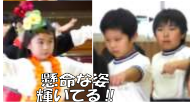
懸命な姿 輝いている!!