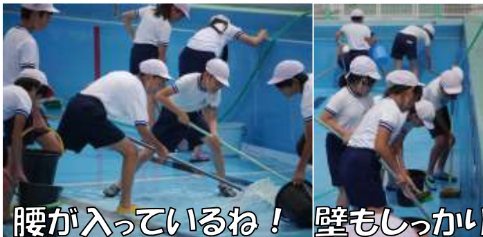
腰が入っているね！ 壁もしっかり

4日(火)の5校時は、6年生によるプール清掃でした。プールの水はきれいに抜かれています。健康指導部教員を中心に泥土状態のゴミはありません。ただ、底にはまだまだ汚れが付着して、横の壁には小さなゴミが張り付いています。仲間同士で「磨き、水で流す」を何度も繰り返していました。また、プール以外のトイレ、更衣室、出入口などもきれいにしていました。